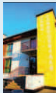
Entrata in oratorio

Con un invitante corollario di iniziative verrà riconsegnata alla comunità di Martignano la casa parrocchiale e la sala polifunzionale che nei mesi scorsi sono state oggetto di un corposo restyling. Dopo il concerto di ieri sera con la Corale S. Isidoro, il Coro Monte Calisio e la Filodrammatica «La Baraca», oggi vi sarà il momento clou della manifestazione. Alle 10.30 l'Arcivescovo di Trento monsignor Luigi Bressan celebrerà la messa nella sala polifunzionale, mentre alle 15 inizieranno alcuni laboratori per bambini. Alle 16.30 concluderà la giornata di festa l'Orchestra «Fuoritempo».