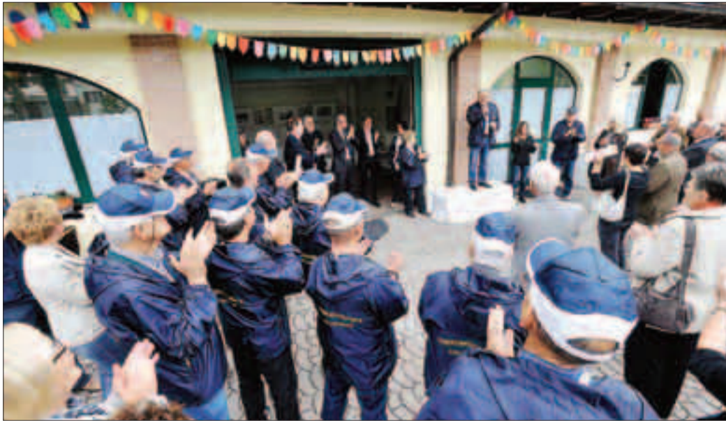
L'inaugurazione della nuova sede di «Trentino Solidale», avvenuta la scorsa estate